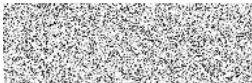
Roman Roušal starosta

ZO hlasovalo: pro 7 proti 0 zdržel se 0 Usnesení bylo přijato