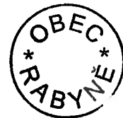
Luboš Mašek, starosta

Přílohy jsou zveřejněny na profilu zadavatele