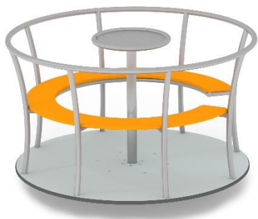
Obrázek je pouze ilustrační.